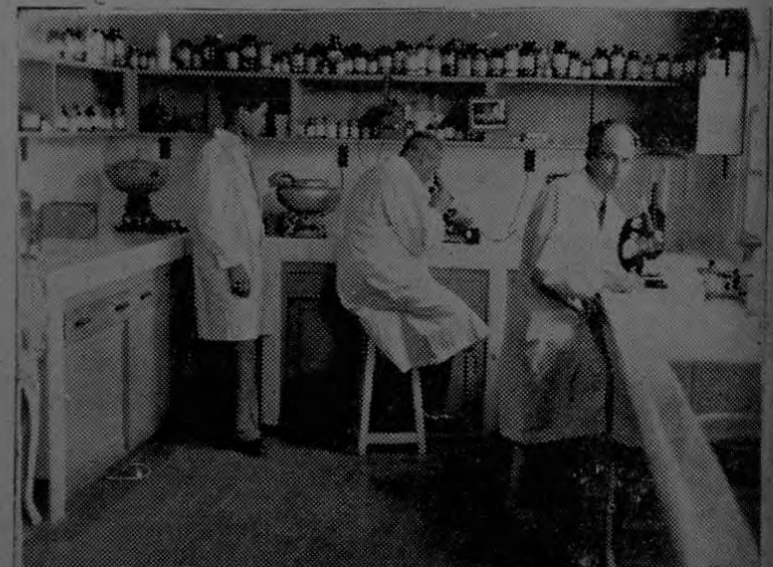
Laboratorio de la Policlínica y el Hospital

"La política de la seguridad social se basa en un vasto conocimiento de la patología social, en el estudio de las causas y los efectos de los riesgos comunes de la vida que afectan principalmente a los económicamente débiles".