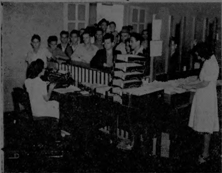
Oficina de Identificación de la Policlínica

La colaboración de los Directores ha sido muy eficaz y todo el personal administrativo coopera con sentido de responsabilidad. Los triunfos deben cobijar a todos.