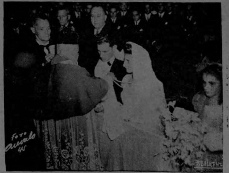
Un aspecto de la velación después de la ceremonia nupcial.

Terminada la ceremonia religiosa, los padrinos e invitados pasaron a la Casa España en donde se efectuó una regia recepción, presentando los salones un animadísimo aspecto por la enorme concurrencia a la fiesta. Con el ánimo inicial se prolongó hasta las horas de la madru-