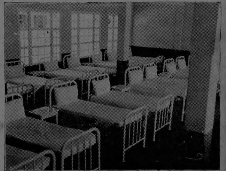
Uno de los salones del Hospital del Seguro Social

Tiene que enorgullecernos—y es honor para la patria y sus gobernantes,— saber que vivimos al ritmo con el mundo, y que contribuimos a poner las bases de la nueva Costa Rica. Cuando se haga historia de este gran movimiento, se verá todo cuanto se ha tenido que hacer para realizar lo que, en el complicado mundo de los seguros, han logrado países que señalan el mayor progreso.